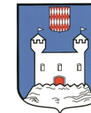
TOURETTE DU- CHÂTEAU